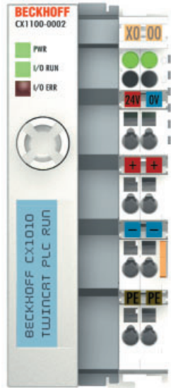
Stromversorgung mit K-Bus-Interface